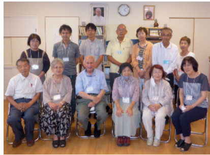
撮影のためマスクを外しています

【結婚】 ①=カトリック同士 ②=カトリックと他のキリスト教 ③=カトリックと他の宗教 ④=非カトリック同士