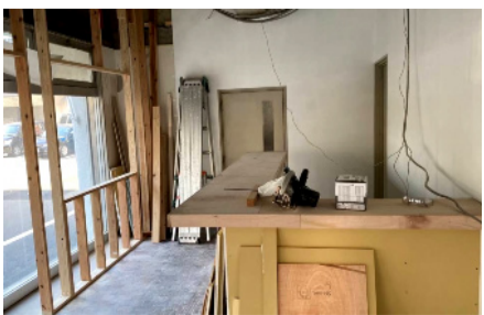
工事の様子と完成予想

完成は9月末から10月上旬になります。名前は皆さんから募集して決めます。楽しみにしててください。完成しましたら皆様一度立ち寄ってみてください。