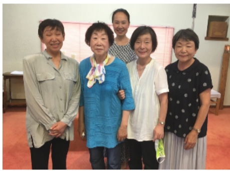
聖体奉仕者の皆さん 記念撮影でマスク取りました

淡々と続く毎日の生活。見失いそうになっていても無意識に祭壇に寄っていく自らの姿にふと気づく瞬間、更に深まった感謝の思いなどをありのままに述べ合っ