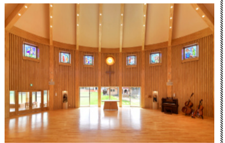
スタンドグラスが配置されたホール

この日「天使たちの家」と名付けられたホールでのミサ聖別式では、ドミニコ会の神父様方をはじめ、ご案内を頂いた旧郡中教会の