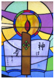
神は愛なり 聖堂ステンドグラス