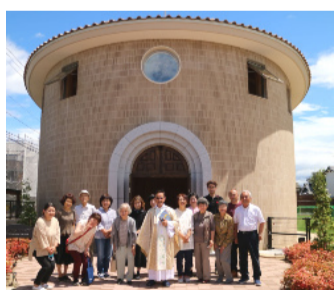
初めてのミサの後で

この場所に集い、皆でお祈りをし、神様の話を聞き、歌い、本を読み・・・幼稚園に本物のすばらしさに触れることのできる子供たちにはなんと幸せなことと思