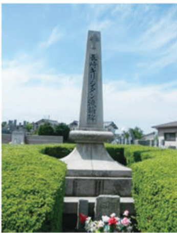
浦上キリシタンの信仰讃え。松山で教区殉教者祭。...