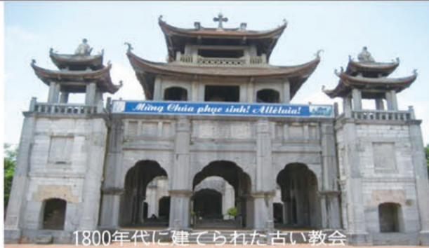
1800年代に建てられた古い教会