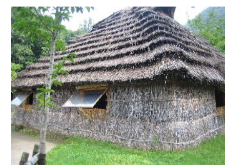
アイヌの住居(展示用)